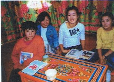
De meisjes zitten gezellig in de ingerichte ger.

Asian Foundation Correspondentieadres: Oude Raadhuislaan 20 3054 NS Rotterdam-NL Telefoon: +31(0)10 4187326