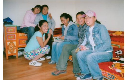
In het nieuwe huis