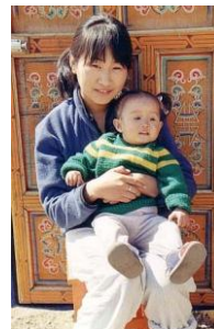
Rechts een foto van nu:

Drie meisjes uit het staatskindertehuis. Alle kinderen hadden net nieuwe kleren gekregen. Twee hebben een kinderbijbel in hun hand. Het middelste meisje kwamen we later in een jeugdcentrum tegen.