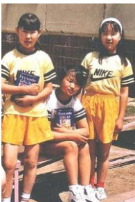
Links een foto uit 1998:

Natuurlijk zijn er wel eens problemen en maken we ons bezorgd over kinderen, maar we hebben oneindig veel meer om dankbaar voor te zijn!