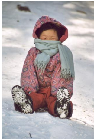
Een dagje uit in de bergen.